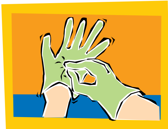
3. Quítese cuidadosamente cada guante. Agarre el primer guante por la palma y sáquese el guante. Toque superficies sucias solamente con superficies sucias.