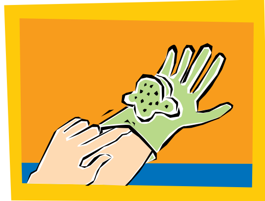
4. Enrolle el guante sucio en la palma de la otra mano enguantada.