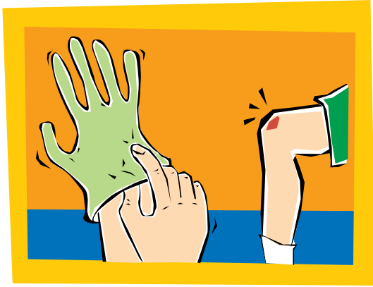
1. Póngase un par de guantes limpios.