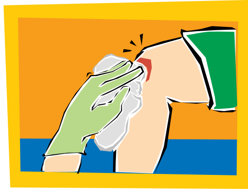
2. Cure debidamente el lugar lastimado.