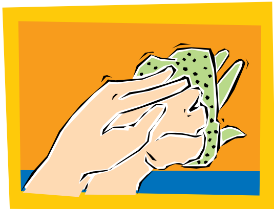
5. Meta la mano limpia debajo de la manga del guante por la muñeca, volteando el guante al revés. Toque superficies limpias solamente con superficies limpias.